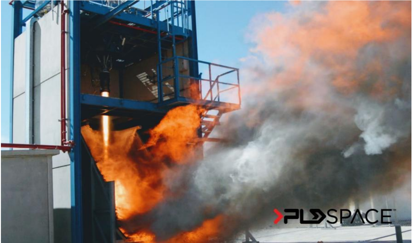
Imagen 1. Prueba de motor en el banco de ensayos T1